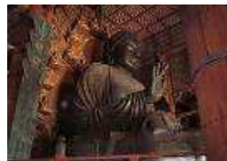
Imagen de Buda