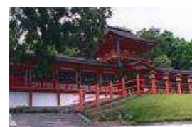
Santuario ShintoIsta de Kasuga