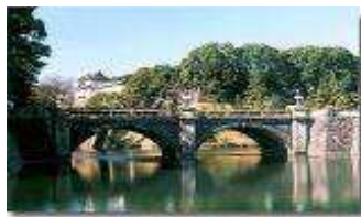
Plaza del Palacio Imperial