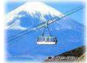
Mt. Komagatake en teleférico