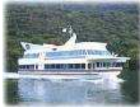
Crucero del lago