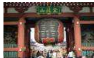
Templo Asakusa Kannon